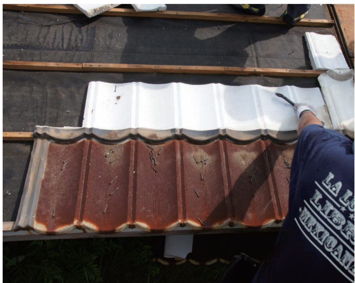
写真(左) 提供: 通気下地屋根構法の設計施工要領作成TG